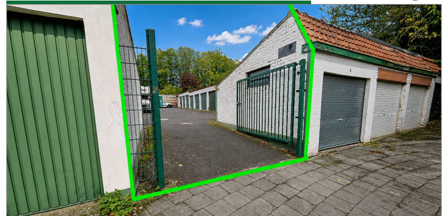
Lot de 7 garages IDEAL INVESTISSEUR

056/34.00.04 www.dlgroupe.com info@cabinet056.be